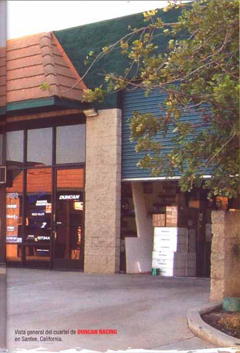
Vista general del cuartel de DUNCAN RACING en Santee, California.

también confesó que tiene miedo de que alguien pueda aprender sus secretos y montar su propio taller. El éxito de D.R.I. radica precisamente en eso, en el trabajo manual y personalizado de cada pieza que se añade o modifica en cada motor, pues es la única forma de tener todo el proceso bajo control.